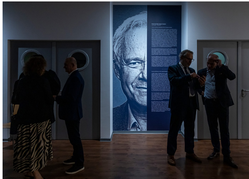
Wernisaż wystawy „Gdańskie ślady Szekspira. Echoes of Shakespeare in Gdańsk: Chodowiecki & Limon”