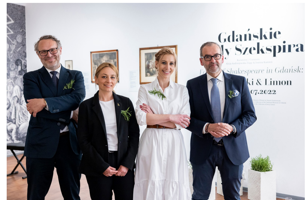
Wernisaż wystawy „Gdańskie ślady Szekspira. Echoes of Shakespeare in Gdańsk: Chodowiecki & Limon”

Rok 2022 był dla Wydawnictwa Uniwersytetu Gdańskiego czasem intensywnej pracy nad publikacją nowych tytułów, ich promocją oraz organizacją wydarzeń kulturalnych i naukowych. W tym okresie podjęliśmy nowe inicjatywy i zakończyliśmy długoterminowe projekty (m.in. w maju udało nam się otworzyć Księgarnię Uniwersytecką na Wydziale Nauk Społecznych Uniwersytetu Gdańskiego!), a także intensywnie współpracowaliśmy z różnorodnymi instytucjami, zarówno przy wydaniu książek, jak i przy tworzeniu wystaw, festiwali czy konferencji naukowych. Jak zawsze wspieraliśmy naszych autorów na każdym etapie procesu wydawniczego – od złożenia książki do redakcji po promocję już po publikacji. Jesteśmy dumni z ich osiągnięć, przyznanych im książkom wyróżnień i nagród