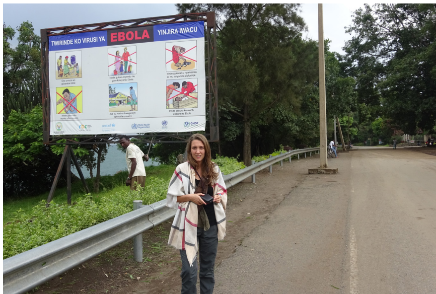
Ebola wciąż groźna. Tablica ostrzegawcza w Gisenyi