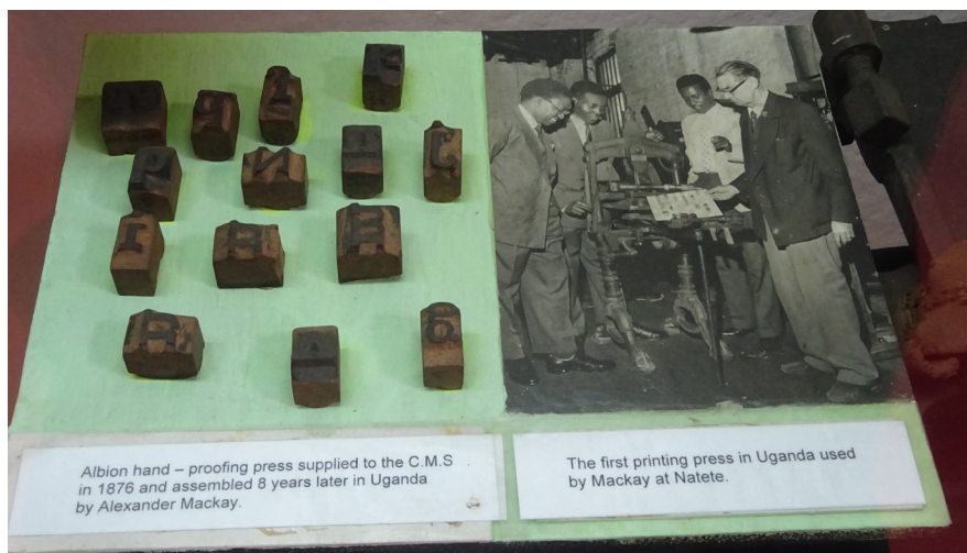
Druk pierwszej prasy w Ugandzie