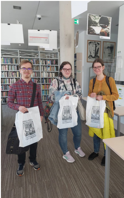
Fot. Małgorzata Śleszyńska