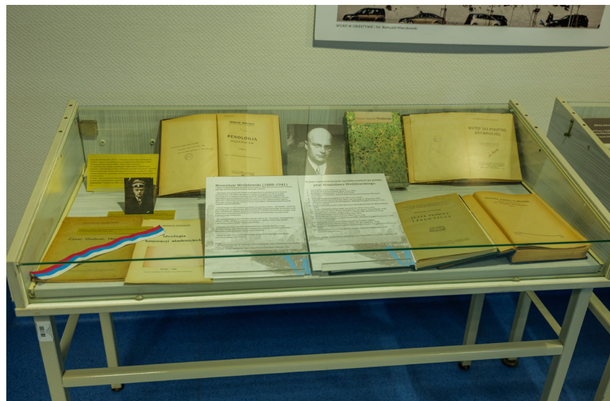
Zbiory prezentowane na wystawie