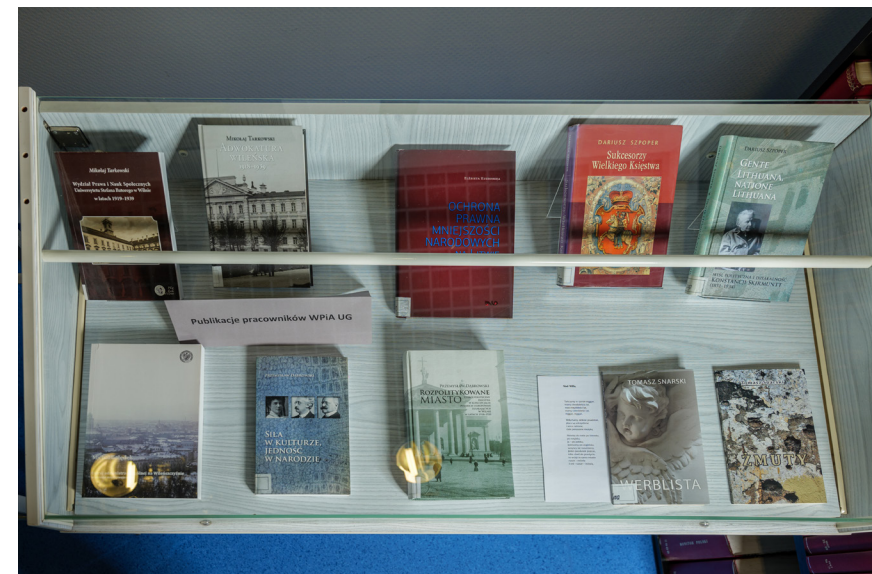
Zbiory prezentowane na wystawie