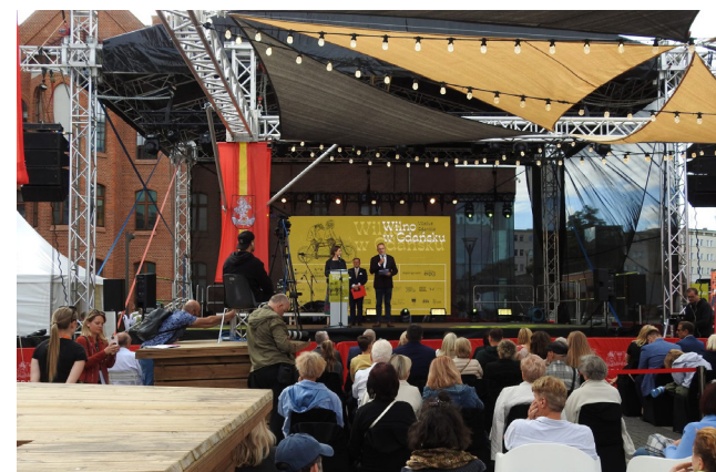
Festiwal „Wilno w Gdańsku”, rok 2022

nie, a ponadto szeroko pojęta tematyka litewska jest obecna w różnorodnych badaniach prowadzonych na naszej uczelni. Są lub byli u nas badacze historii Wielkiego Księstwa Litewskiego, Uniwersytetu Stefana Batorego czy wileńskiej adwokatury oraz