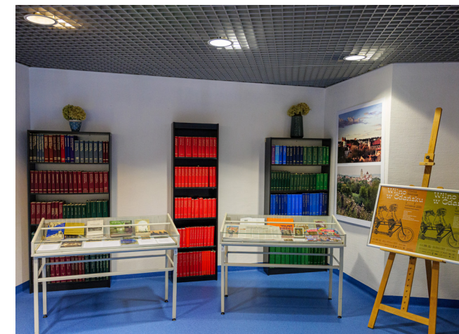
Wystawa „700-lecie Wilna. Wróblewski, Wilno, Miłosz” w Bibliotece Prawnej UG