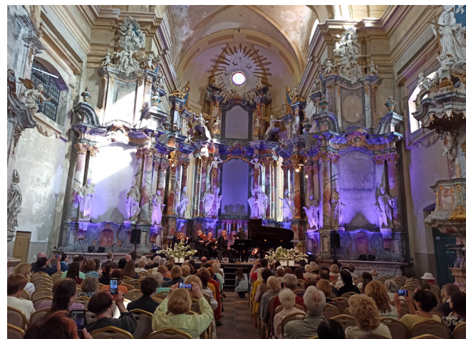
Festiwal „Gdańsk w Wilnie”, rok 2023