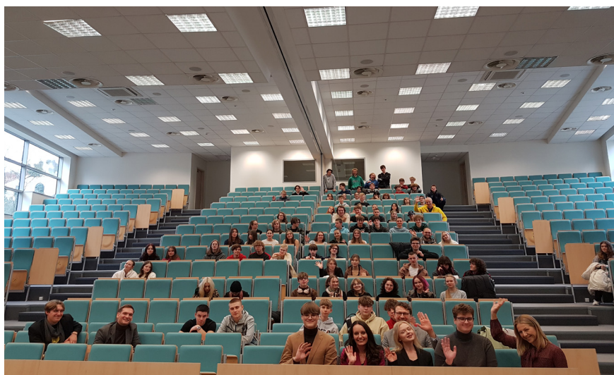
Uczestnicy wywiadu z ekspertem pt. „Wszystko, co chcemy wiedzieć o prowadzeniu start-upu, ale nie mamy odwagi o to zapytać”