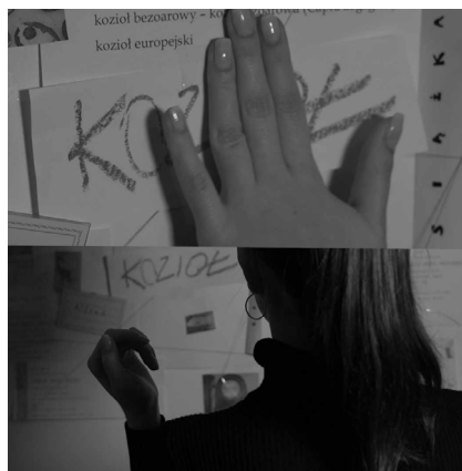
Kadry z filmu Coffee Break