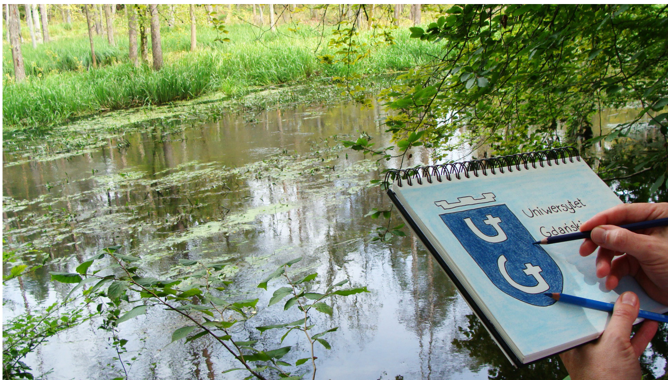
Zwycięskie zdjęcie konkursu „Uniwersytecka pocztówka z wakacji”

Centrum Aktywności Studenckiej i Doktoranckiej jest jednostką, która w strukturze Uniwersytetu Gdańskiego pojawiła się na początku 2021 roku. Zadaniem postawionym przed Centrum przez Jego Magnificencję jest wspieranie i koordynowanie działalności studenckiej oraz doktoranckiej