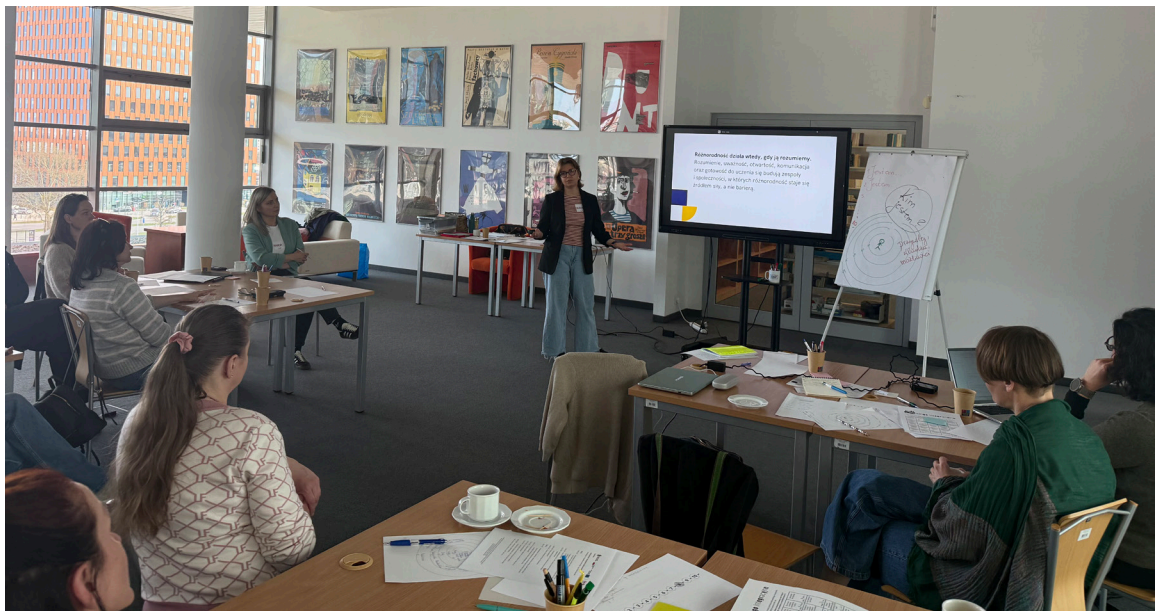
Fot. Sylwia Dudkowska-Kafar

Wchodziłam do sali z ciekawością, wychodziłam z poczuciem odpowiedzialności. Dwudniowe szkolenie o inkluzywności pokazało mi, jak wiele możemy zmienić w akademii, jeśli zaczniemy od siebie – od języka, reakcji, decyzji i codziennych gestów, które budują klimat uczelni. Różnorodność bowiem nie jest wyzwaniem – jest zasobem. Podczas szkolenia Baltic Welcome Hub nauczyliśmy się, jak przekładać tę ideę na praktykę: w dydaktyce, badaniach, komunikacji i relacjach. To dwa dni, które pokazały nam, że przyszłość uczelni zależy od naszej gotowości do zmiany. Inkluzywność to nie moda, lecz konieczność – zaczyna się od wiedzy, refleksji i odwagi, by zmieniać własne nawyki